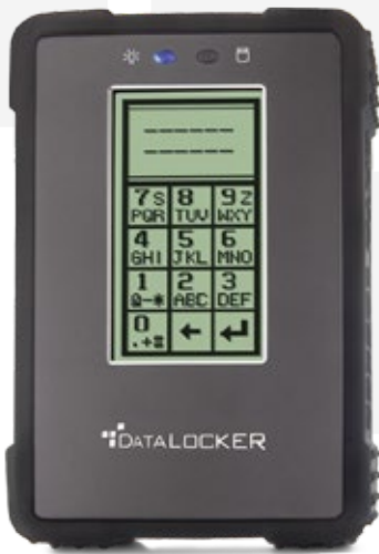
Pantalla táctil de tecnología patentada. Pantalla simulada.