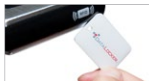
Autenticación RFID de 2 factores opcional

Una segunda opción, para incluir autenticación, utiliza un Tag RFID además de la clave, para mayor protección.