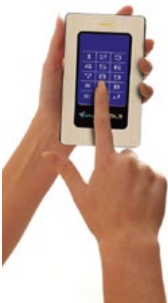
Tecnología patentada de pantalla táctil

Diga adiós a los complicados softwares y drivers - todo el cifrado, administración y autenticación DL3 se realizan en la misma unidad y se gestionan a través de la tecnología de pantalla táctil fácil de usar.